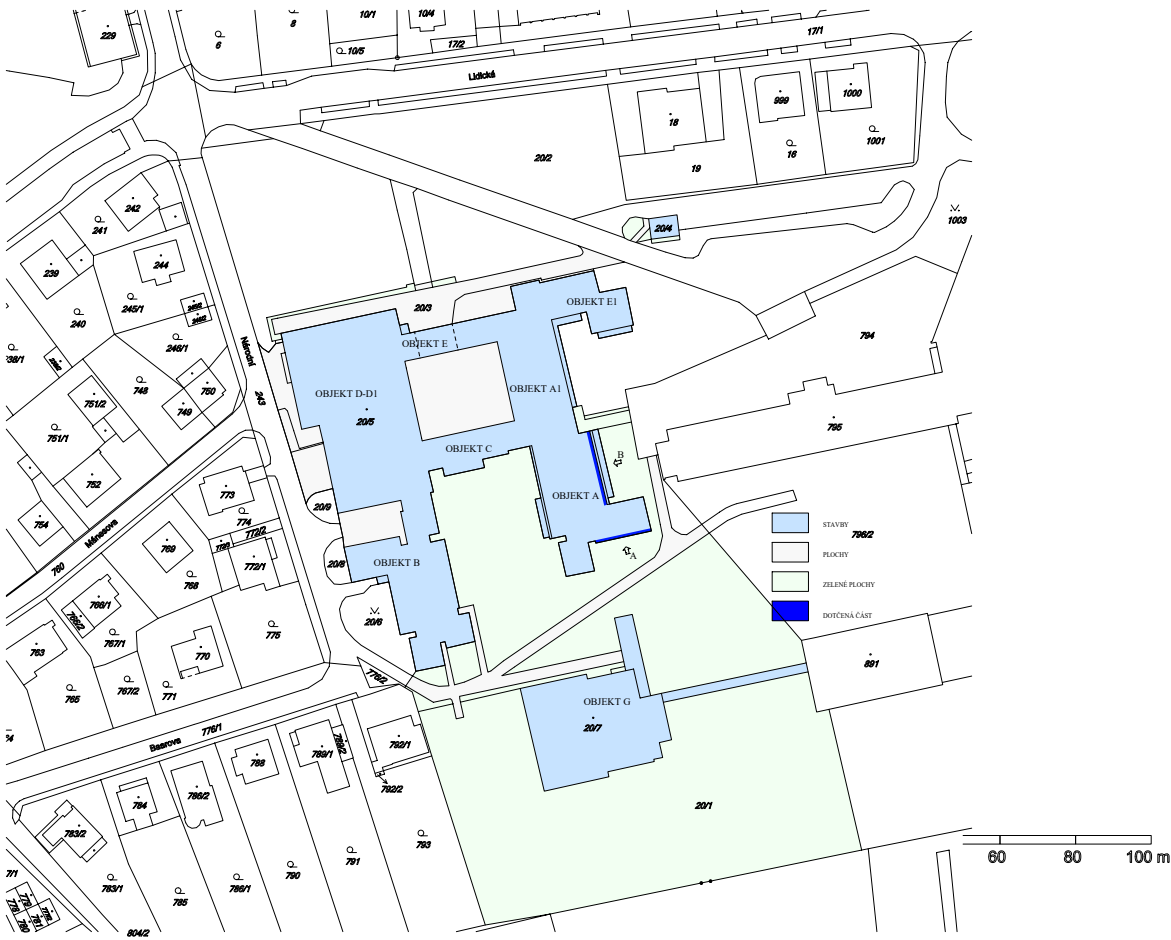
KATASTR. SITUACE 1 : 2 000